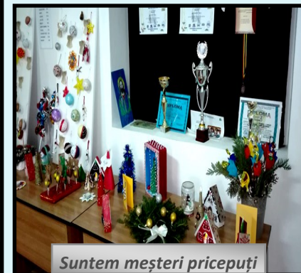
Suntem meșteri pricepuți