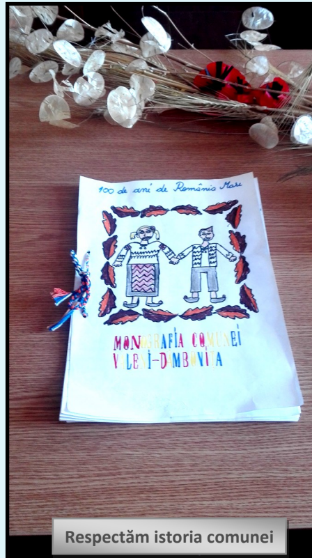
Respectăm istoria comunei