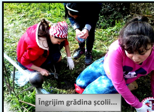
Îngrijim grădina școlii...