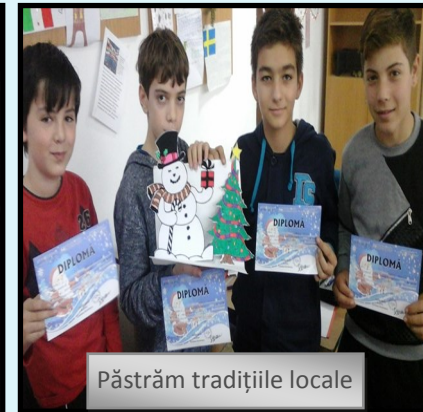
Păstrăm tradițiile locale