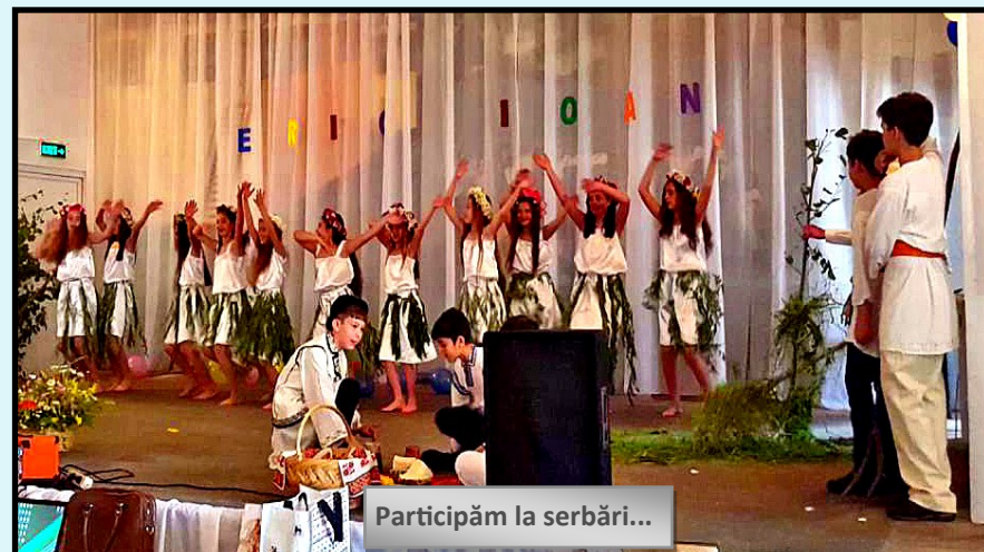
Participăm la serbări...