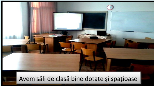
Avem săli de clasă bine dotate și spațioase